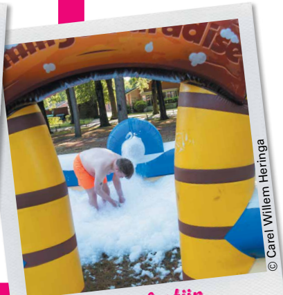
Waterfestijn Cultureel Centrum